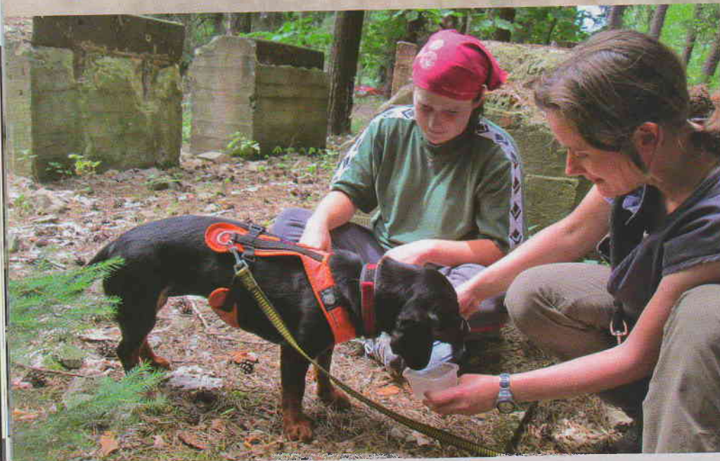
Nalezení osoby MT-týmem při reálném zásahu je zřídka fenomén.