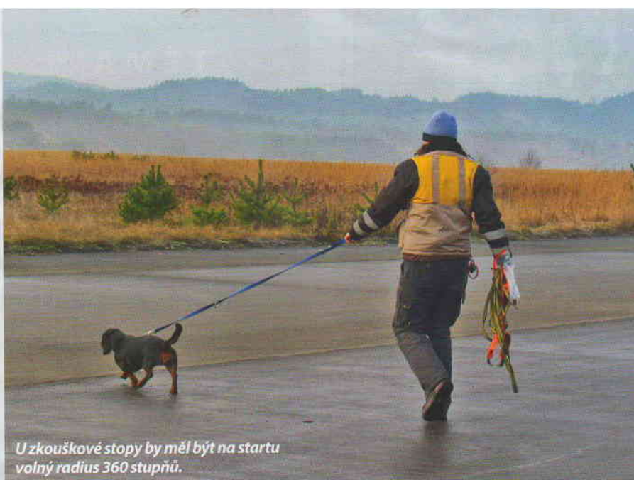
U zkouškové stopy by měl být na startu volný radius 360 stupňů.

SP 3 – zde se musí každý psovod se psem zúčastnit, stejně jako v SP1, přezkoušení u policie. Zajímavé ale je, že i přestože nároky při přezkoušení jsou stejné jako v SP1, je zde zcela odlišná úspěšnost. V této spolkové zemi je úspěšnost u této zkoušky kolem 50 %. Úspěšnost při reálném zásahu je stejná jako v obou předchozích SP.